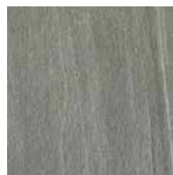
Green - White