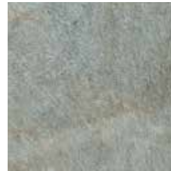
Pietra di Lavis