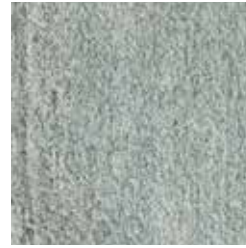
Pietra di Bagnolo